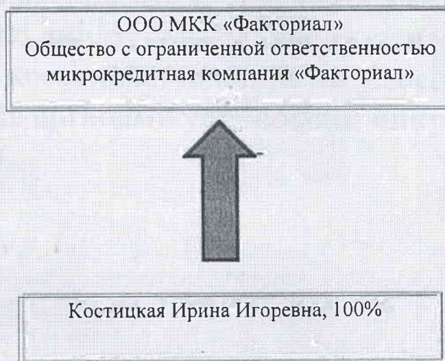
Схема взаимосвязей Общества и лиц, оказывающих существенное (прямое или косвенное) влияние на решения, принимаемые органами управления Общества